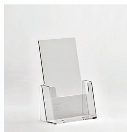
Prospekthalter für Theken A6L einfach