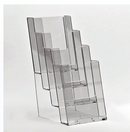
Prospekthalter für Theken 4 x A6L