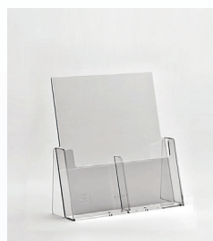
Prospekthalter für Theken A6L doppelt