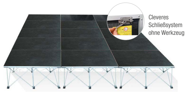
Beispiel mit à 15 Podesten entsprechen ein 15m 2 großes Podium