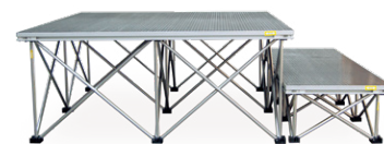
Podest M (40 cm) mit einer Treppe (20 cm)