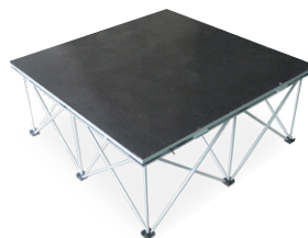
Ein Podest entsprechen 1m 2