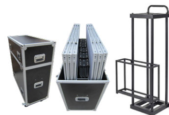
Flight Case & Transportwagen