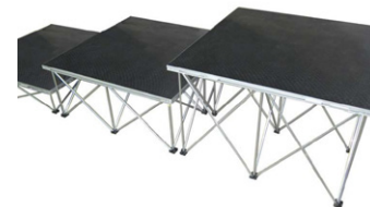
Podium S, M und L kombinierbar