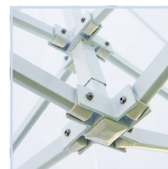
Verbindungen aus gegossenem Aluminium