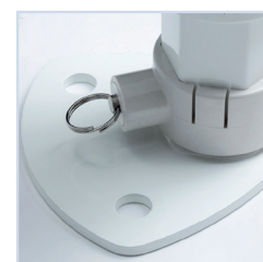
Füße mit Bodenplatte