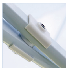
Kräfteverteilung am Übergang der Verbindungen